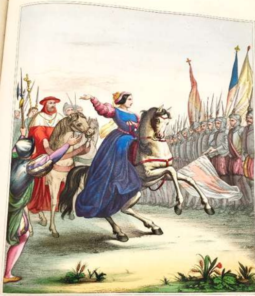
CRISTINA DI SVEZIA